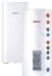
Комбіновані (непрямі) водонагрівачі