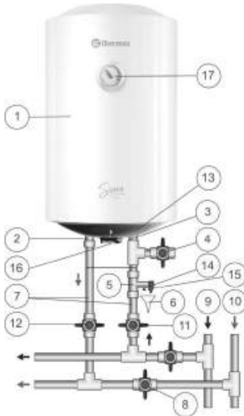
Малюнок 1. Схема підключення ЕВН до водопроводу

Малюнок 1: 1 – ЕВН, 2 – патрубок гарячої води, 3 – патрубок холодної води, 4 – зливний вентиль, 5 – запобіжний клапан, 6 – дренаж у каналізацію, 7 – підведення, 8 – перекрыти вентиль при експлуатації ЕВН, 9 – магістраль холодної води, 10 – магістраль гарячої води, 11 – запірний вентиль холодної води, 12 – запірний вентиль гарячої води, 13 – захисна кришка, 14 – дренажний вихід запобіжного клапана, 15 – ручка для відкриття запобіжного клапана, 16 – ручка керування, 17 – індикатор температури.