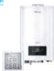
Електричні котли та кімнатні термостати