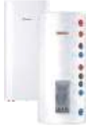
Комбіновані (непрямі) водонагрівачі