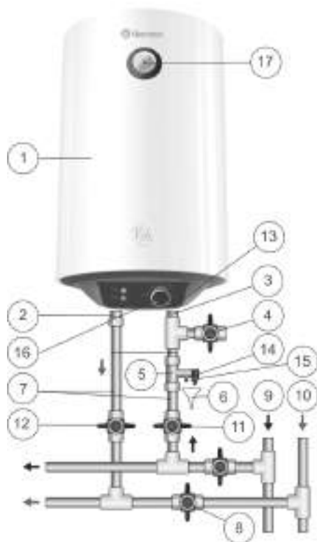
Рисунок 1. Схема підключення ЄВН до водопроводу

При монтажі не допускається прикладення надмірних зусиль, щоб уникнути пошкодження різьби патрубків.