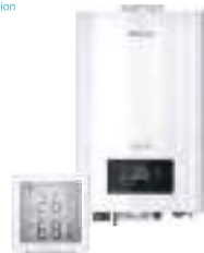
Електричні котли та кімнатні термостати