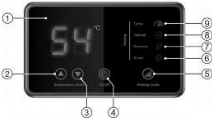
Малюнок 2. Електронна панель управління

1 - LCD дисплей, 2 - кнопка "▲" Temperature control / збільшення температури нагріву, 3 - кнопка "▼" Temperature control / зменшення температури нагріву, 4 - кнопка "On/Off" / вкл./викл, 5 - кнопка "Heating mode" / установка потужності нагріву - режиму роботи, 6 - індикація розумного режиму «Smart», 7 - індикація "Economy" / Мінімальна потужність, 8 - індикація "Optimal" / стандартна потужність, 9 - індикація "Turbo" / максимальна потужність.