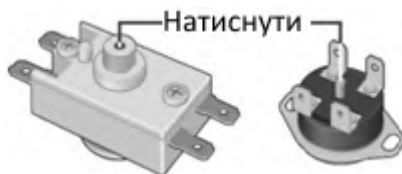
Малюнок 3. Схема розташування кнопки термовимикача

Перераховані несправності не є дефектами ЕВН і усуваються споживачем самостійно або за його рахунок.